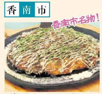
もだんやき (ヤ・シバーク内) ・もだん焼き ・中田そば ・とんべり焼き