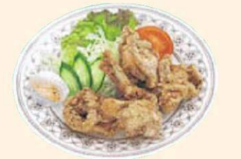
かどりのからあげ (のいち)