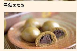
エチオピア饅頭 エチオピア大使公邸菓子となっている野市名物の黒糖饅頭