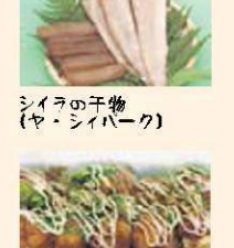
シラのうどん (ヤ・シバーク)