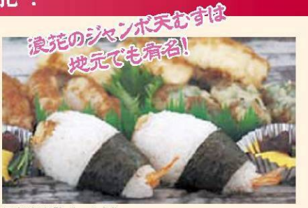
天むす海苔 (のいち)

季節によって変わる地域ならではの“食”は地元運転手さんにお任せください。観光ガイドブックにも掲載していない自慢の味、地元ならではの人気の商品を観光ガイドタクシーでゲット。コース、時間を相談しながら体験してください。以下はその一部を紹介します。