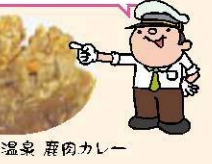
べふ峰温泉 鹿肉カレー

この地にも、Puro・FALO (ぷー・たろ) のしろうがを使ったジンジャー・シロップや、キョウボックワン(景福堂)の韓国料理、やました食品「松尾酒造」の酒の風味を生かしたおやきアイスなど、まだまだ人気商品が!