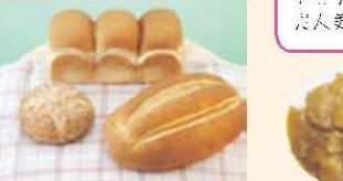
延生の里 美良市直販店 米粉を使った米粉パン

この地にも、Puro・FALO (ぷー・たろ) のしろうがを使ったジンジャー・シロップや、キョウボックワン(景福堂)の韓国料理、やました食品「松尾酒造」の酒の風味を生かしたおやきアイスなど、まだまだ人気商品が!