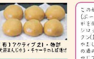
(有) アクティブ21・物部 大塚まんじゅう・チャーチのしほ餅